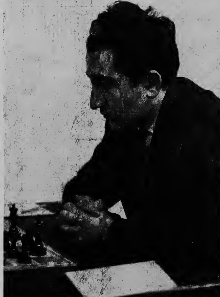
E ruso Tigran Petrosian, cu lo participa na e torneo di ajedrez cu pronto lo tuma luga na Antillas. E ta ser considera como un di e hungadornan di mayor oportunidad.